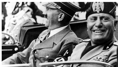
Hitler zu Besuch bei Mussolini in Venedig 1934

Nachfolgender Abriss der Geschichte Italiens hilft, die Ereignisse einzuordnen.