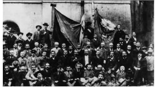
Gründungskongress der PSI 1892

Weil die Industrialisierung fast ausschließlich der Rüstung zugute kam und nicht einer Erhöhung des Lebensstandards