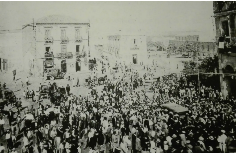
Demonstration gegen die Teuerung

Der 15. April blieb – wie seine Rede vor der Arbeiterschaft der Stahlwerke Franchi i Gregorini – bis Ende von Mussolinis Diktatur im Jahr 1943 wesentlicher Bestandteil der faschistischen Legendenbildung. So schuf der futuristische und kubistische Maler Enrico Prampolini für eine faschistische Kunstausstellung im Jahr 1932 zwei riesige Bilder von jeweils 5x6 Metern zum Andenken an das blutige Ereignis.