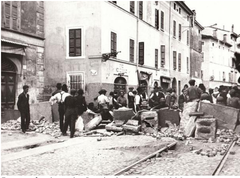
Eine antifaschistische Barrikade in Parma 1922

Höhepunkt überschritten hatte. Aber noch wäre es nicht zu spät gewesen, wenn die Arditi del Popolo eine breite, aktive und auch formelle Unterstützung durch die großen Arbeiter- und Landarbeiterorganisationen erfahren hätten. Sie zählten nach wenigen Monaten immerhin 20.000 Mitglieder, blieben aber weitgehend auf sich allein gestellt mit ihrer eigenen Kultur und eigenen Symbolen des Antifaschismus.