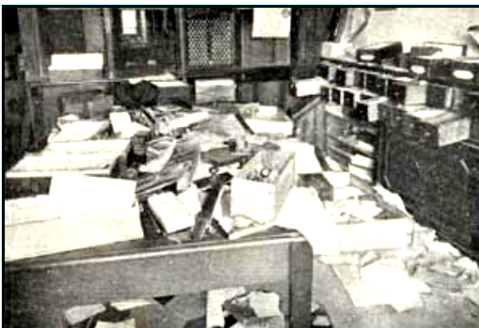
Die Zerstörung der Zentrale der Metallarbeitergewerkschaft

Aber schon am gleichen Abend jenes 10. Septembers sagten die Gewerkschaftsführer zu den sozialistischen Führern: »Ihr glaubt, dass der Augenblick der Revolution gekommen ist. Schön. Wir fordern euch auf, die Führung der Gesamtbewegung zu übernehmen.« Die Sozialisten bekamen kalte Füße und gaben den Ball zurück an