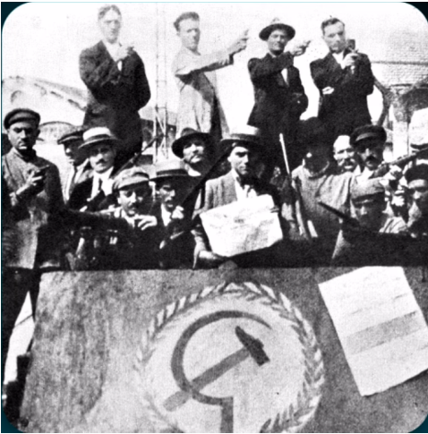
Bewaffnete Metallarbeiter besetzen ihre Fabrik

beule PSI sagen, sie wollen die Macht erobern, um so Italien zu regieren. Und was hindert sie daran? Warum machen sie das nicht?»