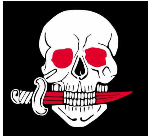
Das Symbol der Arditi del Popolo

Die Faschisten hatten weitere Vorteile über ihre Gegner. Sie waren bewaffnet, sogar mit Maschinengewehren. Obwohl verboten, wurden sie nie deswegen belangt, ganz anders als die Arbeiter. Ein weiterer großer Vorteil war die Beweglichkeit der Squadristen. Sie konnten auf ihren LKWs von weitem herkommen, während die Arbeiter und die Landarbeiter an ihre Wohnorte gebunden waren. Es war der Vorteil des Bewegungskriegs gegen den Stellungskrieg, wie es Tasca formuliert.