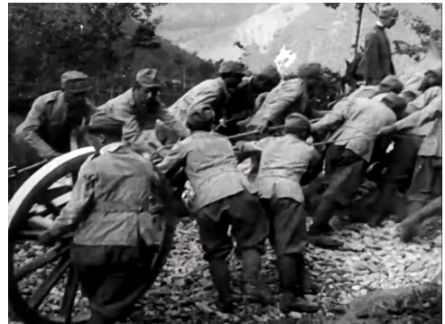
Italienische Soldaten in der verlorenen Schlacht von Caporetto im November 1917

Die Militanz der italienischen Arbeiterbewegung in den Jahren bis zum Ersten Weltkrieg – wegen des Ausnahmezustands kurzzeitig eingefroren – nahm im letzten Kriegsjahr und nach Kriegsende wieder an Fahrt auf.