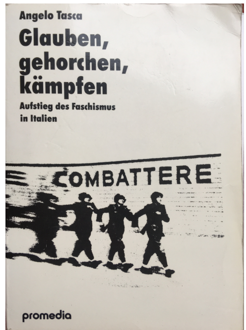
Ein Klassiker, um den Faschismus zu verstehen

Die Sozialdemokratie, die heutige Hauptvertreterin des parlamentarisch-bürgerlichen Regimes,