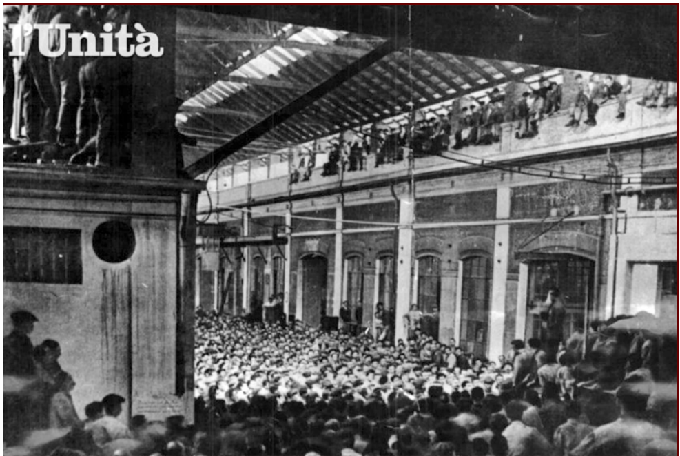
FIAT-Arbeiter im Besetzungstreik -- 500.000 Metalller nehmen ihre Fabriken in die eigene Hand

In seiner Rede schwor Mussolini, das Parlament, so wie es bestand, zu zerstören. Nur die Ex-Soldaten, die »Aristokratie der Schützengräben«, hätten das Recht, Gesetze zu erlassen. Er wolle die vollkommene Freiheit des Volkes.