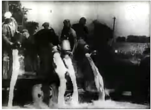
Landarbeiter verschütten die Milch

Die ärmere Landbevölkerung in der fruchtbaren Po-Ebene bestand aus Landarbeitern, Halbpächtern, Pächtern und Kleinbauern – ihnen gegenüber standen die Großgrundbesitzer und die mit ihnen