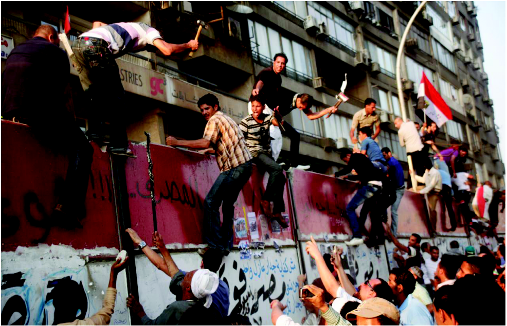
Protestierende erklimmen die Mauer um die israelische Botschaft in Kairo

Westliche Kommentatoren waren anfänglich perplex. Journalisten und Akademiker suchten verzweifelt nach Erklärungen. War Facebook die Ursache? Waren die Volksaufstände ein Ausdruck von Sehnsucht nach westlicher Demokratie? Oder riefen die Menschen nach einer neuen islamistischen Ordnung?