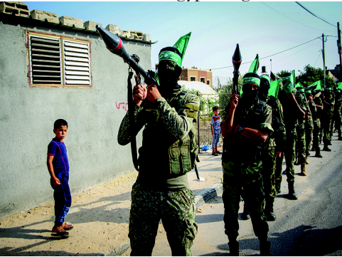
Der bewaffnete Flügel der Hamas

Ihre Wurzeln gehen jedoch auf Gazas islamistische Vereine und Wohltätigkeitsorganisationen zurück, die Aktivisten in den 1970er Jahren unter dem Einfluss der Muslimbruderschaft Ägyptens gründeten.