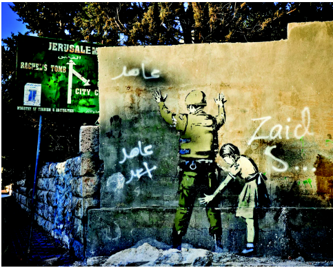
Mädchen durchsucht Soldaten an der Mauer

dank ihrer »symbiotischen Beziehung mit der israelischen Besatzung« Reichtum anhäufen konnte: