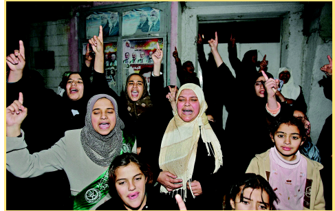
Palästinenserinnen feiern Wahlsieg der Hamas 2006

Ihr Rassismus und ihre Verbrechen gegen schiitische Muslime und Christen stehen im Widerspruch zu der Idee, dass die Einheit der Unterdrückten eine wesentliche Voraus-