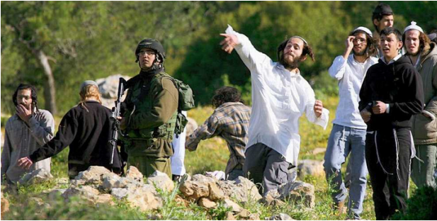
Israelische Siedler werfen Steine auf palästinensische Einwohner

Staat im Jahr 1948 waren seine Führer für die Massenvertreibung von hunderttausenden Palästinensern und Palästinenserinnen und die Zerstörung von hunderten palästinensischen Dörfern verantwortlich. Das erfüllt den Tatbestand einer ethnischen Säuberung.