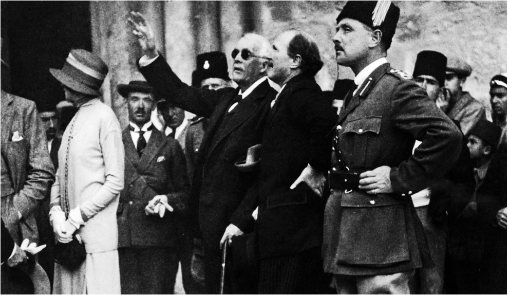
Britischer Außenminister Balfour in Jerusalem 1925