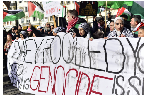
Demonstration in Mannheim am 24. Februar 2024. Eine der Parolen war: "One solution, revolution!"

Die Palästinasolidaritätsbewegung in Deutschland, oft als wenig aussichtsreich betrachtet, erlebt einen Aufschwung. Junge Palästinenserinnen und Palästinenser erheben ihre Stimme und organisieren sich in Gruppen wie »Palästina Spricht«. Der Staat antwortet mit Repression, verbietet Demonstrationen oder schikaniert sie, doch sie finden statt. Ideologisch haben die westlichen Regierungen den Kampf schon verloren, es braucht jedoch wesentlich mehr Druck, vor allem in Form von Boykotts und Streiks gegen Rüstungskonzerne und andere, die Handel mit Israel betreiben, auch Boykotts gegen Israels »Kulturexporte« an Unis und in den Bereichen Musik und Sport.