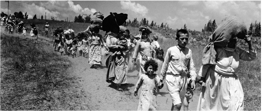
Aus ihrer Heimat vertriebene Palästinenser:innen

Pioniere des europäischen Kolonialismus statt als Vorkämpfer für die Unterdrückten zu agieren.