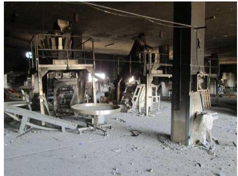
Die Keksfabrik Al-Awda wurde 2014 an vier verschiedenen Tagen 2014 zerbombt

Während der 1990er Jahre schnitten ständige Schließungen der israelisch kontrollierten Grenzen palästinensische Güter von