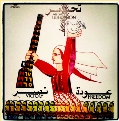
Poster der Fatab 1978

Unsere bedingungslose Unterstützung für die Hamas ist jedoch nicht unkritisch, denn wir sind der Meinung, dass die Strategien der Bewegung im Kampf für die Befreiung Palästinas – wie die von der Fatah und der palästinensischen Linken zuvor verfolgten Strategien – versagt haben und auch in