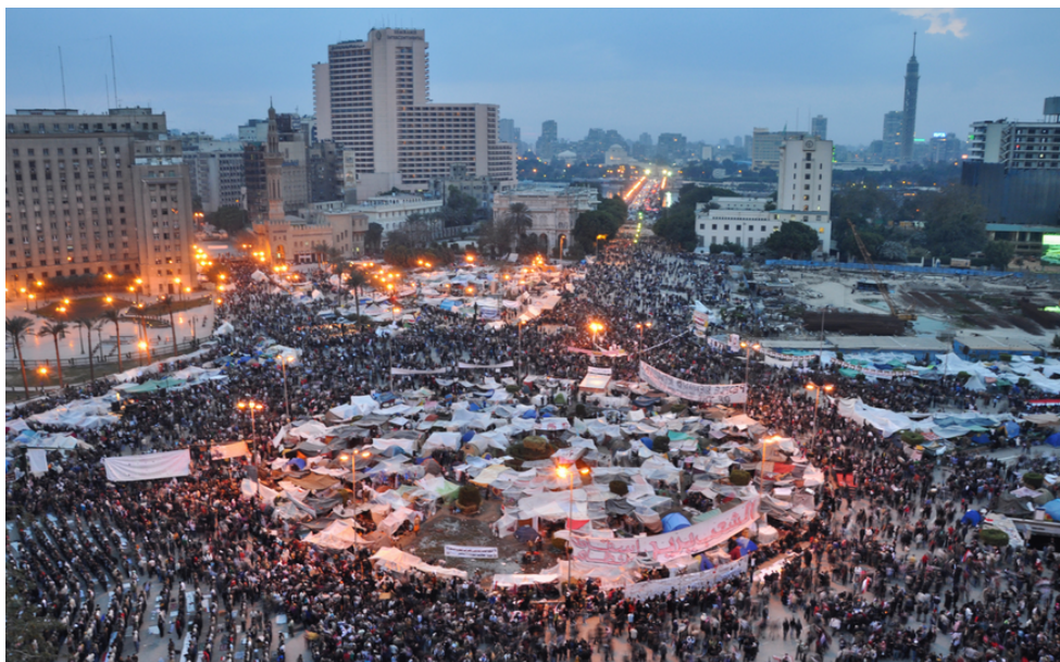
Massenbesetzung des zentralen Tahrir-Platzes in Kairo Anfang 2011

felten Versuch zu reduzieren, seine gut betuchten Spender und seine Wählerbasis zufriedenzustellen. Die Fortsetzung und gar Verschärfung seiner Politik durch seinen Nachfolger Biden zeigt es.