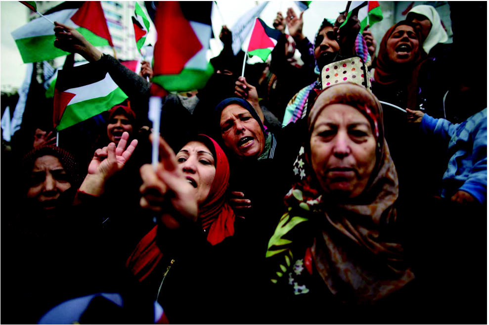
Protest gegen die Verlegung der US-Botschaft nach Jerusalem