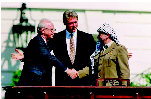
Rabin und Arafat reichen sich vor Clinton die Hand