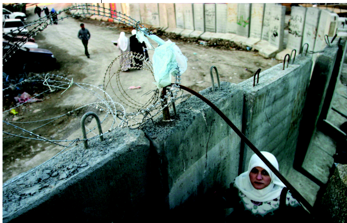
Israels Apartheid-Mauer schlängert sich durch die Westbank, sperrt palästinensische Communities ein und zerstört ihre Häuser und Felder. Die 6 bis 8 Meter hohe Mauer hat eine Gesamtlänge von 660 Kilometern.

Die Bedingungen der Vereinbarung zeigten deutlich, dass es sich um ein Abkommen zwischen zwei gänzlich ungleichen Seiten handelte. Die PLO hatte mit