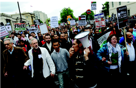
Gaza-Flotilla-Demo 2010 in Großbritannien