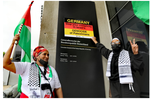
Protest vor dem deutschen Generalkonsulat in Kapstadt gegen das Verbot der Nakba-Demonstration in Berlin 2022

Die derzeitige Lage zeigt Parallelen zum Vietnamkrieg Mitte der 1960er Jahre. Es entstand damals eine weltweite Solidaritätsbewegung mit dem Kampf der Vietnamesinnen und Vietnamesen, und damit eine neue revolutionäre Linke, auch in Deutschland. »Wir brauchen ein freies Palästina... Wir brauchen kein geteiltes Palästina. Wir brauchen ganz Palästina.« So Malcolm X in einer Rede 1965. Das muss unser Ziel sein: