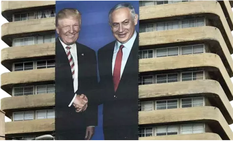
Wahlplakat: Netanjabu Hand in Hand mit Trump

Jahren intensiviert, während die direkte Wirtschaftshilfe, die einst zentral für die Aufrechterhaltung der israelischen Wirtschaft war, abgewickelt wurde. Die Aufrechterhaltung des militärischen Vorsprungs Israels gegenüber seinen Nachbarn ist seit langem ein zentrales Ziel der US-Politik.